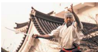
オープニングアトラクション