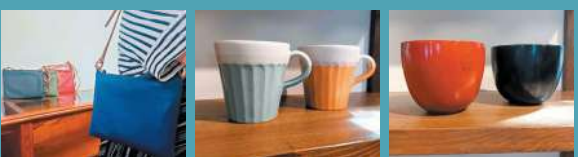
＜プレゼントの一例＞

参加スポットを訪れて集めたスタンプの数に応じてプレゼントに応募できる。会津地域を一日中楽しんで、すてきなプレゼントをゲットしよう！