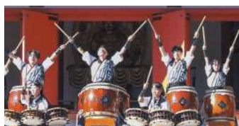
オープニングアトラクション