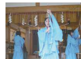
会津磐梯巫女舞保存会

日本遺産「会津の三十三観音めぐり」や会津ゆかりのアーティストなどのパフォーマンスをお楽しみください。